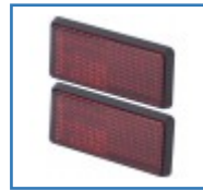
Reflektoren 2er Pack