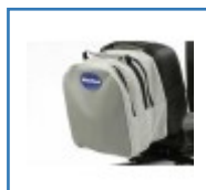
Scooter Tasche für die Rückenlehne