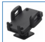
Smartphonehalter mit Klebefestigung für Rollatoren, Rollstühle und Scooter