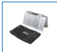
Rampe Rollstuhl / Scooter