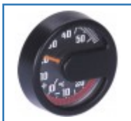
Thermometer für Rollatoren, Rollstühle und Scooter