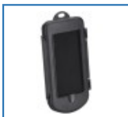
Smartphonehalter mit Spritzschutzbox für Rollatoren, Rollstühle und Scooter