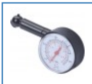
Reifendruckprüfer für Scooter