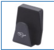
Brillenablage für Rollatoren, Rollstühle und Scooter