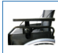
Höhen- und Längenverstellbare Armlehnen