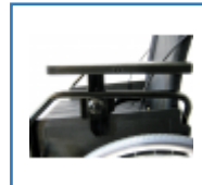
Höhen- und Längenverstellbare Armlehnen