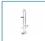
Sauerstoffflaschenhalter für Rollstühle