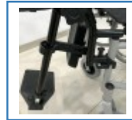
Hochschwenk- und feststellbare Beinstützen