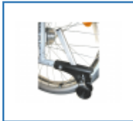
Antikipp - Hilfe