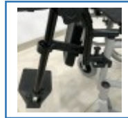
Hochschwenk- und feststellbare Beinstützen