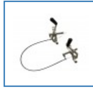
Einhand-Feststellbremse für Rollstühle