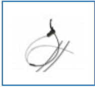
Einhandbremse für Rollstuhl für Begleitperson