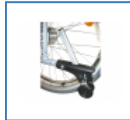
Antikipp - Hilfe