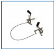
Einhand-Feststellbremse für Rollstühle