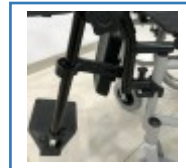
Hochschwenk- und feststellbare Beinstützen