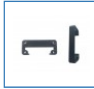
Adapterplatte für Armlehnenverbreiterung