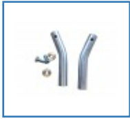
Adapter Set für PowerStroll