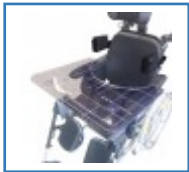
Multitec Zubehör Paket