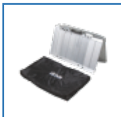
Rampe Rollstuhl / Scooter